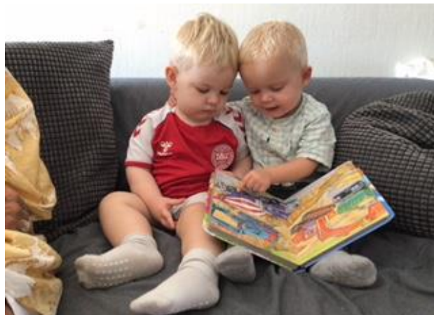
Børnene læser højt for hinanden