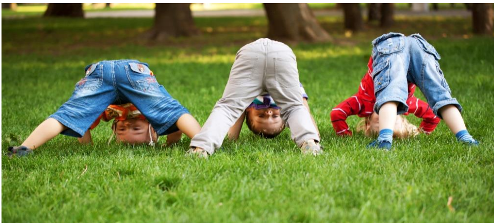
Børnene oplever samhørighed og spejler hinanden